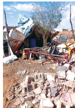
Lerombolt templom Kartúmiban

Komoly veszélye van annak, hogy a házi gyülekezetek vezetőit és munkatársait a jövőben börtönbüntetésre ítélik. Folyamatos rendőri megfigyelés alatt állnak. Kérjük Istent, hogy védje meg ezeket a vezetőket és mindazokat Kínában, akiket folyamatosan üldöznek.